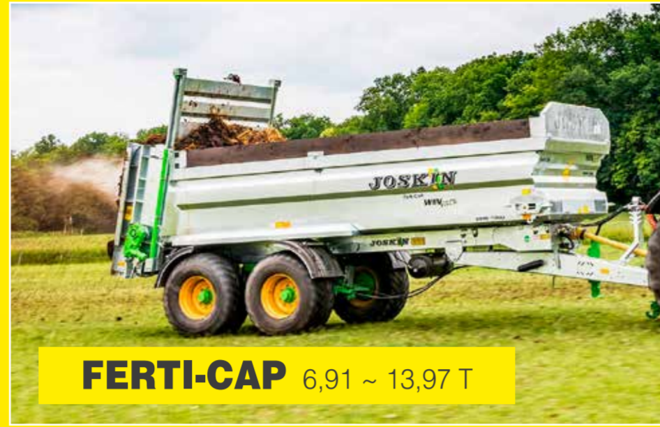
FERTI-CAP 6,91 ~ 13,97 T