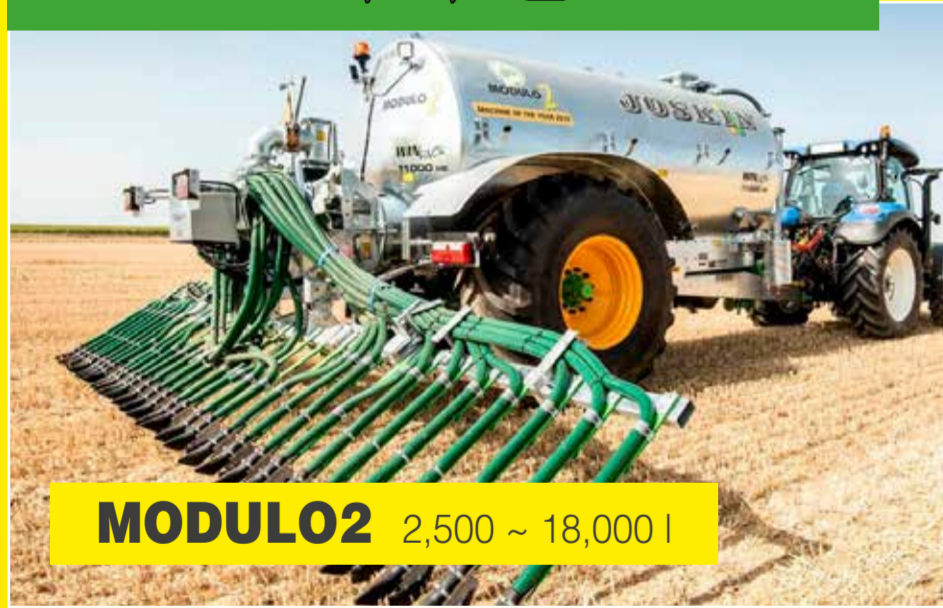
MODULO2 2,500 ~ 18,000 l