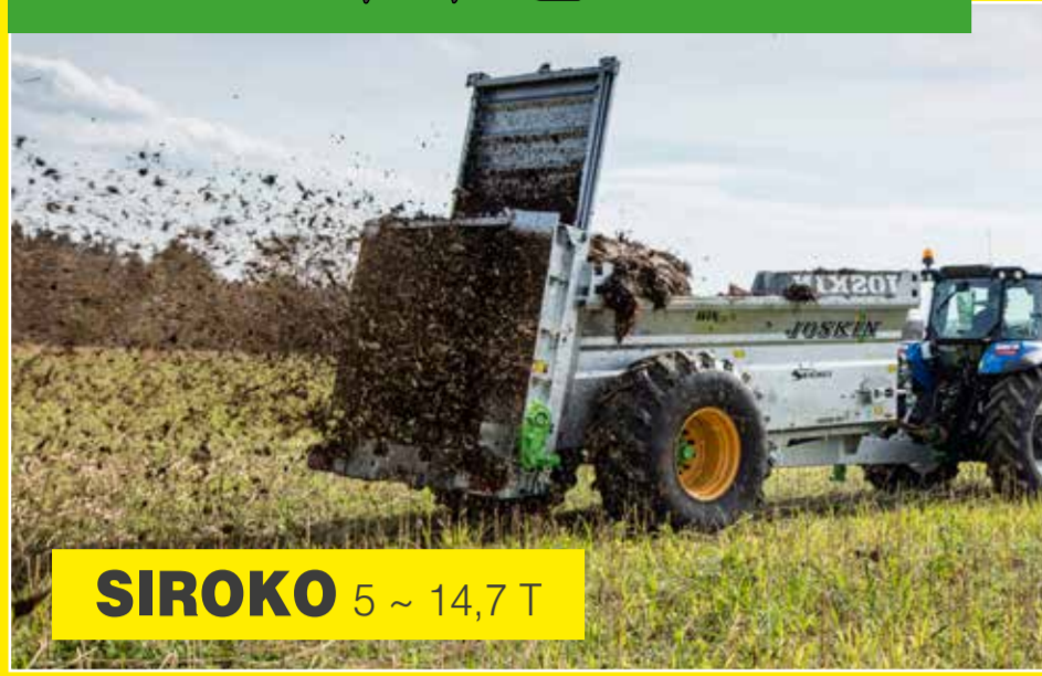
SIROKO 5 ~ 14,7 T