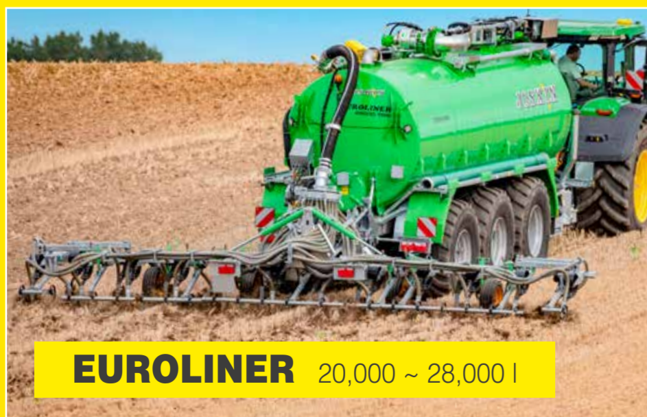
EUROLINER 20,000 ~ 28,000 l

75가지의 모델이 있는 JOSKIN 현탁액 살포기. 700가지 이상의 선택 사양이 요구를 충족시킵니다. JOSKIN은 특수 철강 종류를 선택하고 작업합니다. 모든 현탁액 대형 트럭은 완벽하게 요구를 충족시킬 수 있도록 서로 다른 후면 기구들과 맞출 수 있습니다.