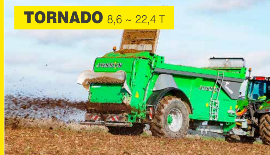
TORNADO 8,6 ~ 22,4 T