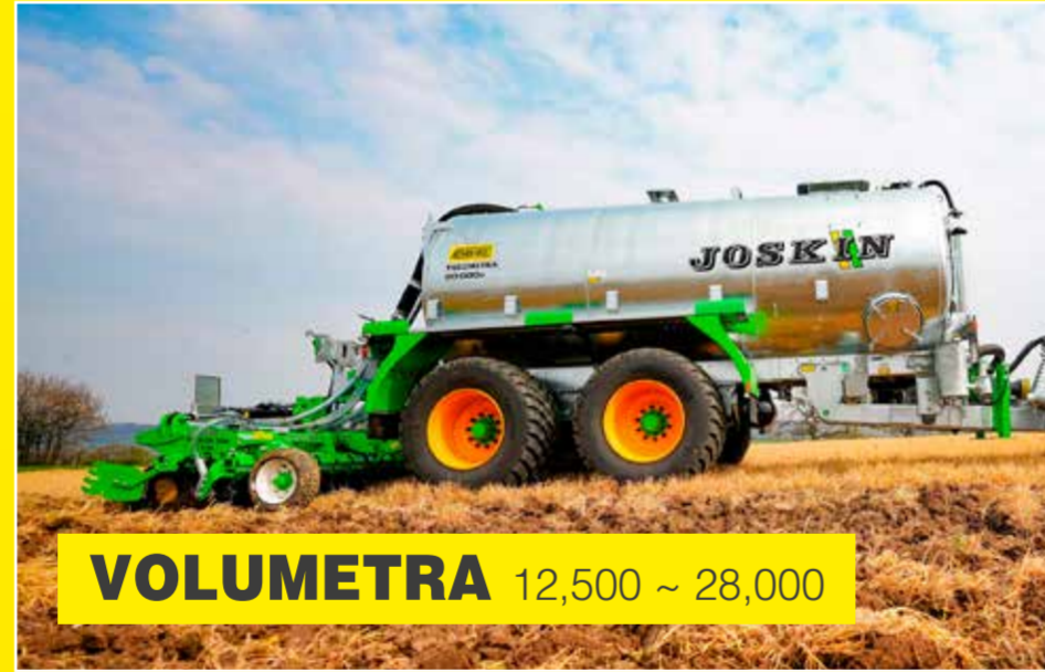
VOLUMETRA 12,500 ~ 28,000