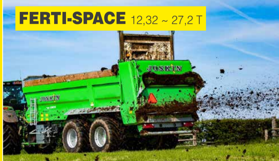
FERTI-SPACE 12,32 ~ 27,2 T