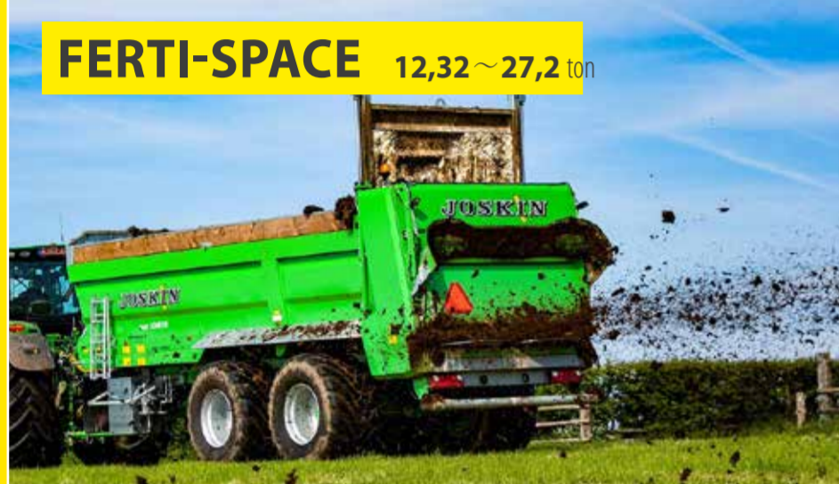
FERTI-SPACE 12,32~27,2 ton