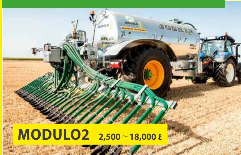
MODULO2 2,500~18,000 ℓ