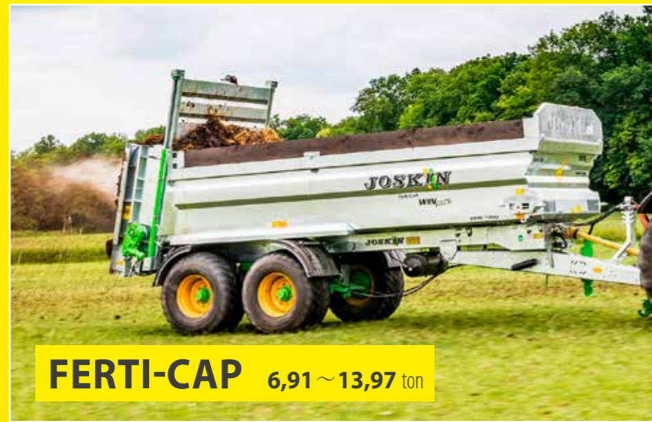
FERTI-CAP 6,91~13,97 ton