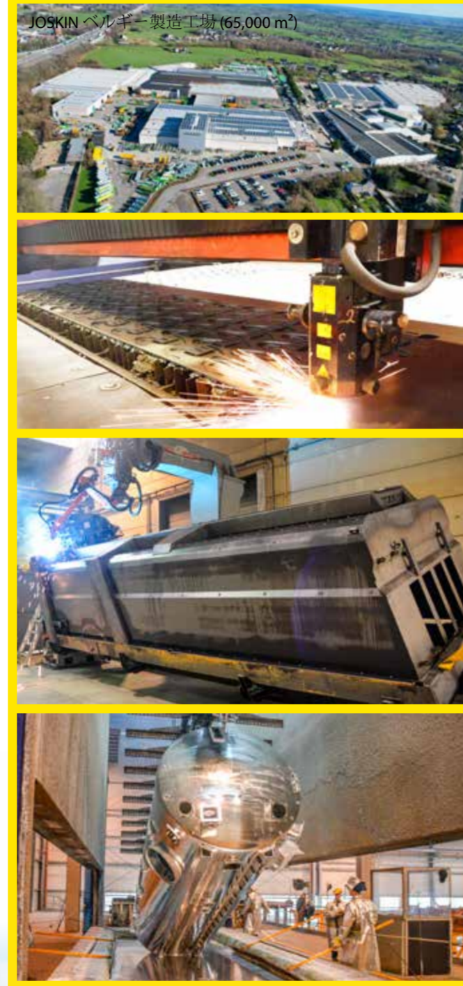
JOSKIN ベルギー 製造工場 (65,000 m 2 )

JOSKINの製造拠点(約150,000m 2 の広さ)は世界5か所にあります。(ベルギー2か所、ポーランド、フランス2か所) 私たちが採用している最新技術の中には、ヨーロッパではまだ珍しい技術もあります。(3Dダイナミックシミュレーション、自動レーザー、折りたたみプレス、高張力鋼、溶融亜鉛メッキなど)