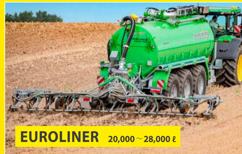
EUROLINER 20,000~28,000 ℓ