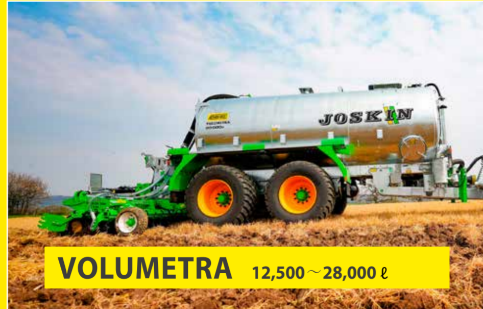
VOLUMETRA 12,500~28,000 ℓ