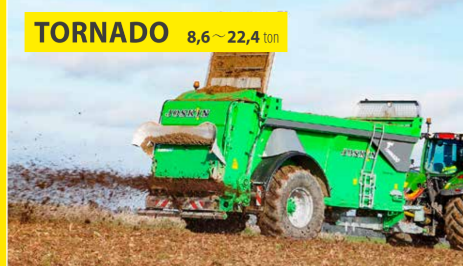
TORNADO 8,6~22,4 ton