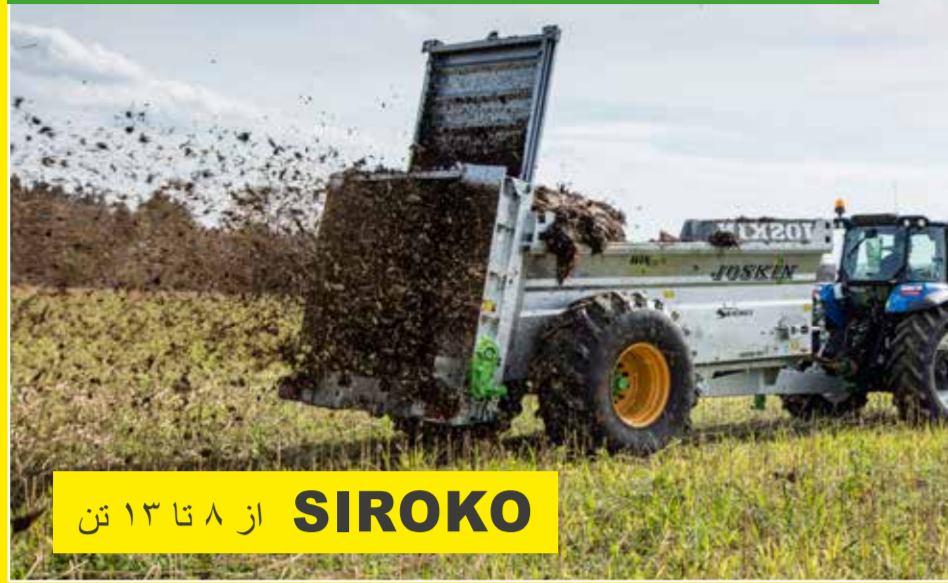
SIROKO از ۸ تا ۱۳ تن