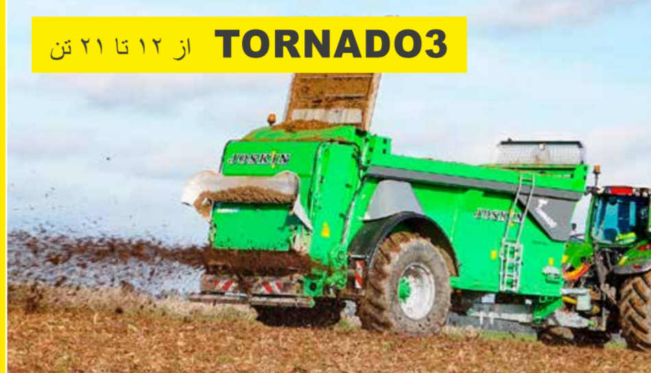
TORNADO3 از ۱۲ تا ۲۱ تن