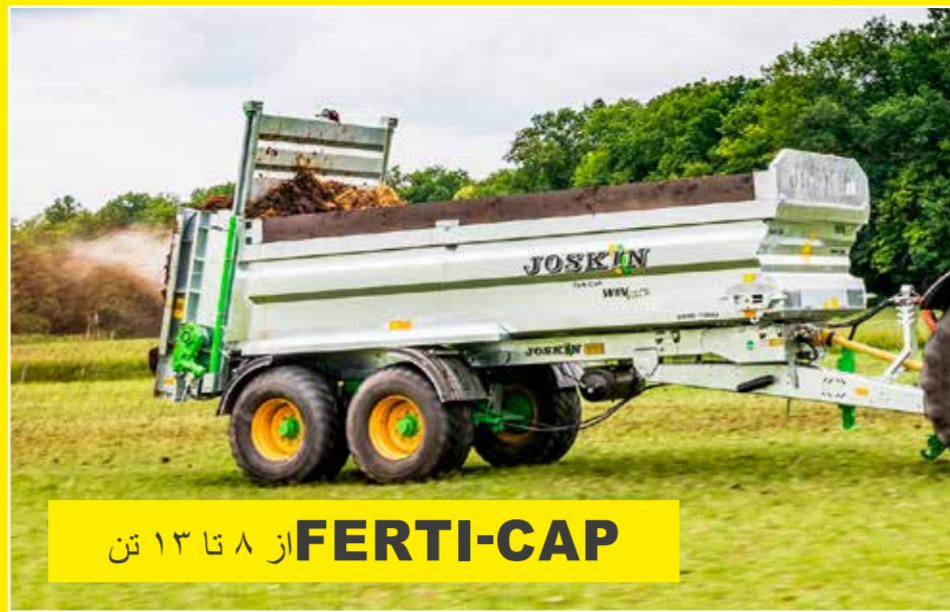
FERTI-CAP از ۸ تا ۱۳ تن