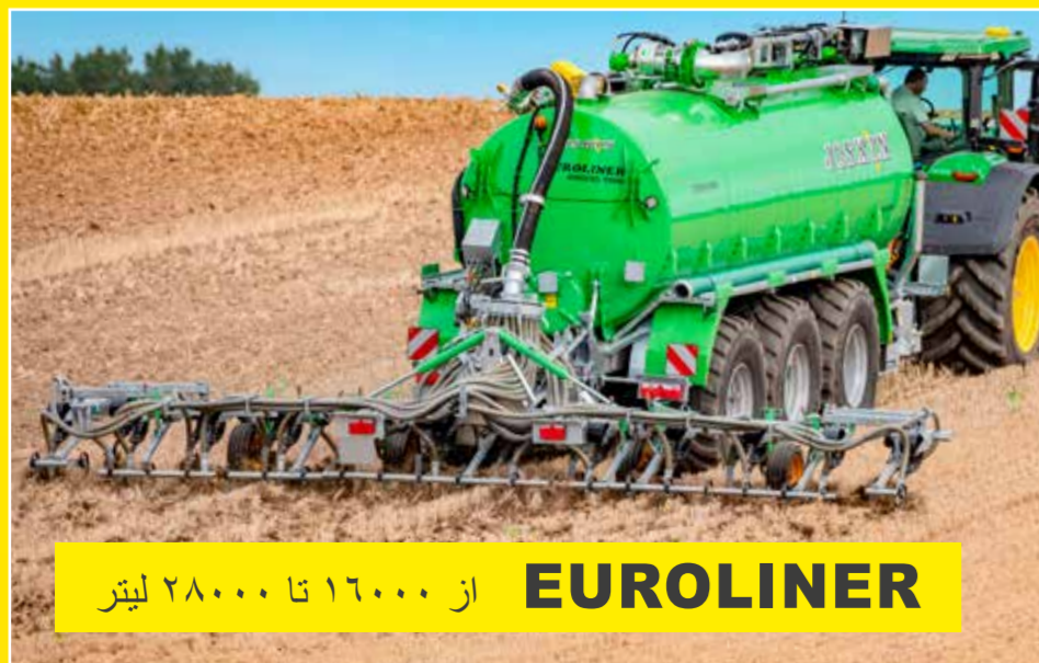
EUROLINER از ۱۶۰۰۰ تا ۲۸۰۰۰ لیتر