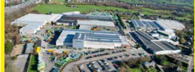
واحد تولیدی ژسکن در بلژیک (۶۵۰۰۰ متر مربع)