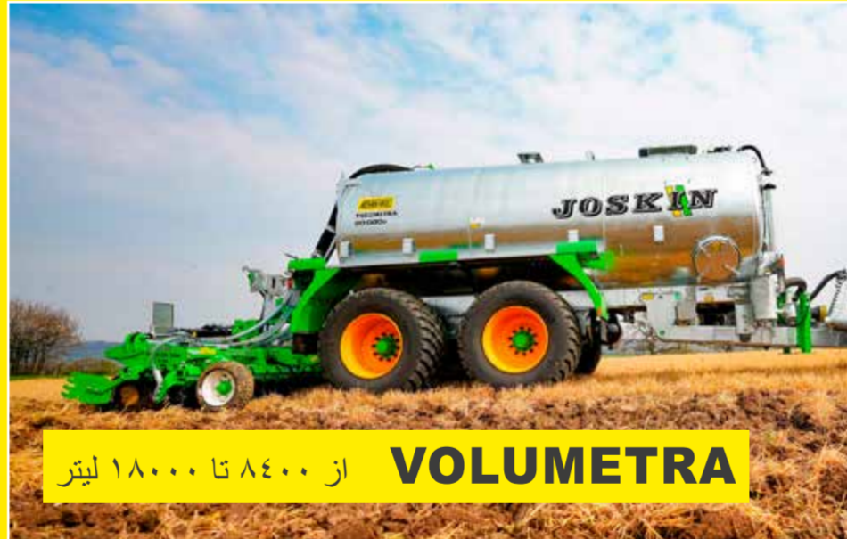
VOLUMETRA از ۸۴۰۰ تا ۱۸۰۰۰ لیتر