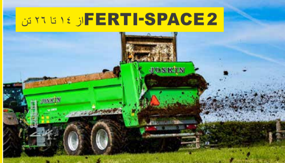
FERTI-SPACE 2 از ۱۴ تا ۲۶ تن