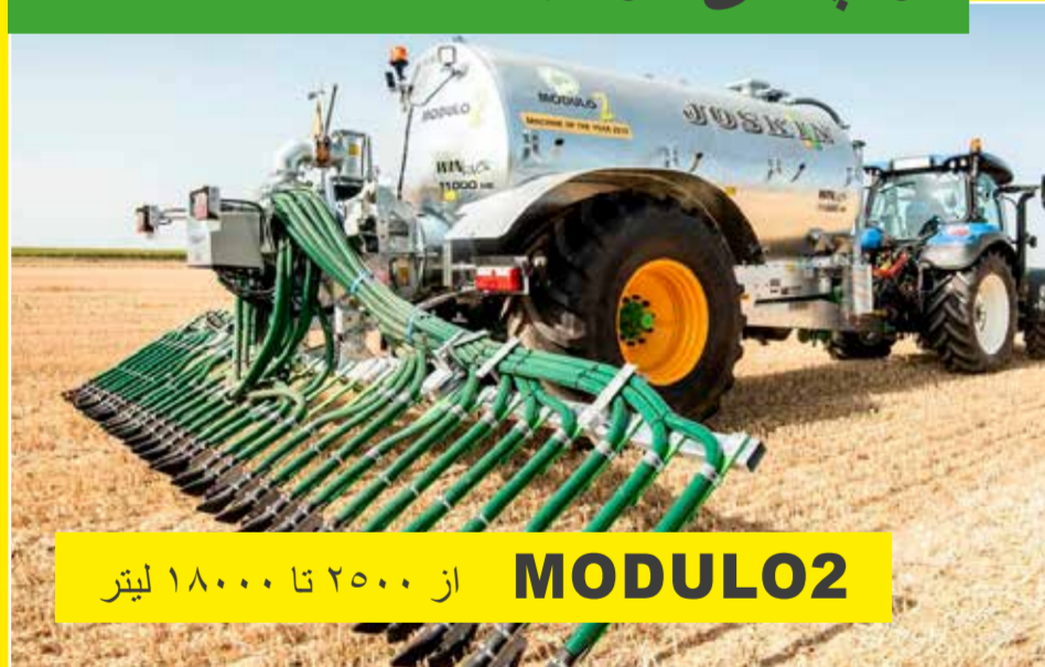
MODULO2 از ۲۵۰۰ تا ۱۸۰۰۰ لیتر