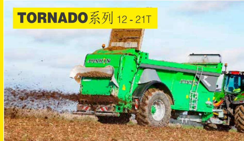
TORNADO 系列 12-21T