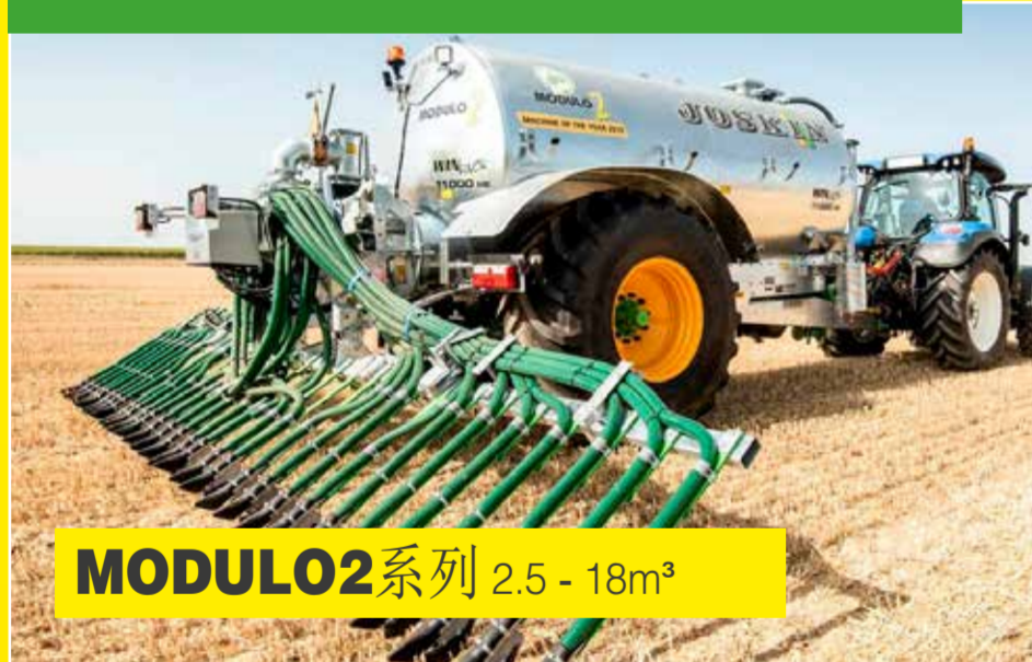
MODULO2 系列 2.5-18m 3