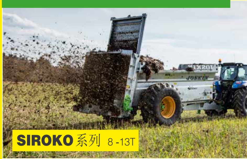
SIROKO 系列 8-13T