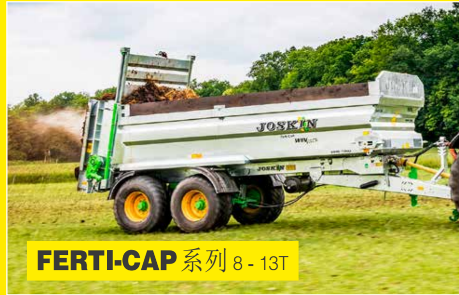
FERTI-CAP 系列 8-13T