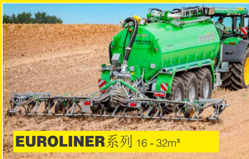
EUROLINER 系列 16-32m 3

JOSKIN 公司的液体施肥罐车共有75个大类, 超过700种型号。可以满足客户的各种需求。