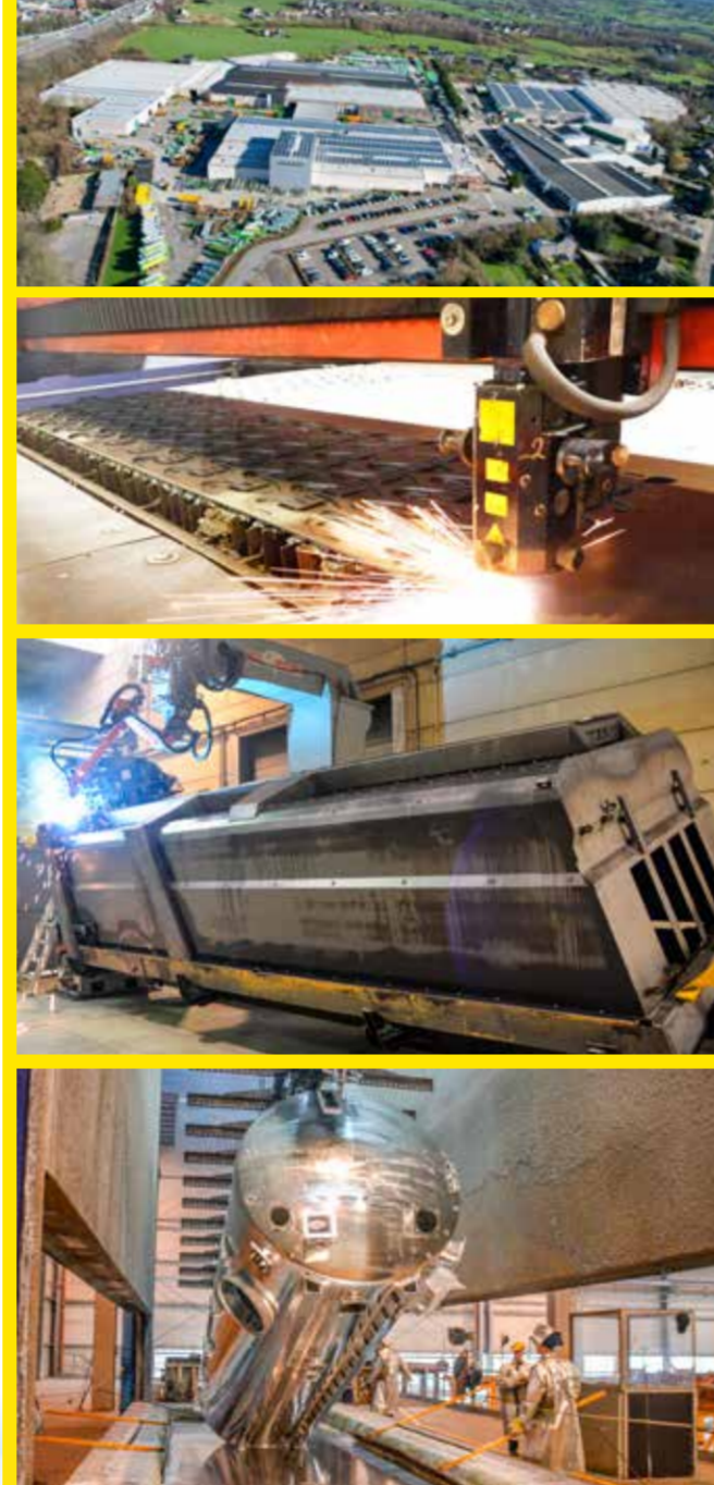
JOSKIN Belgium production unit 比利时总部工厂 (65,000 m 2 )

我们采用世界上最先进的加工工艺。有些是欧洲独有的加工工艺：3D动态仿真、自动激光、锻压、高强度钢、热浸镀锌等。