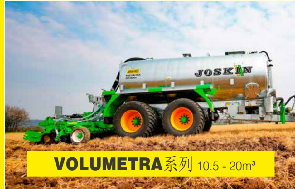
VOLUMETRA 系列 10.5-20m 3