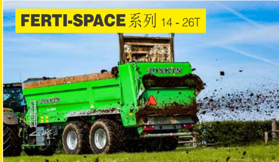
FERTI-SPACE 系列 14-26T