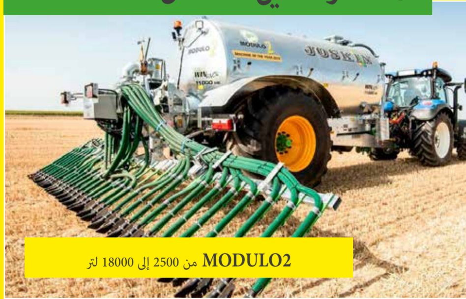
MODULO2 من 18000 إلى 2500 لتر