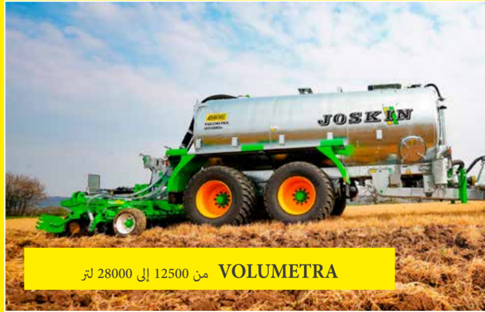
VOLUMETRA من 12500 إلى 28000 لتر