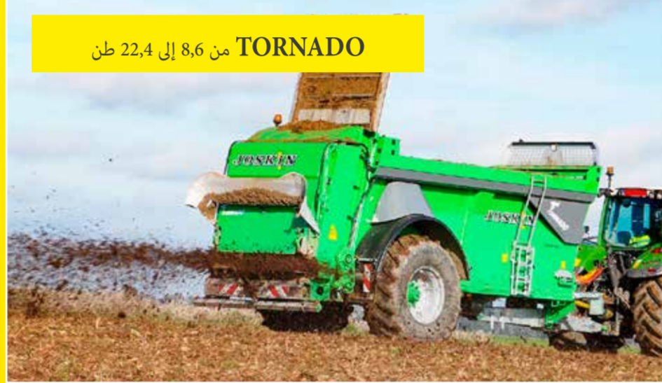
TORNADO من 8,6 إلى 22,4 طن