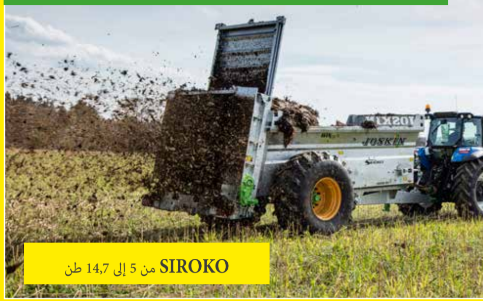
SIROKO من 5 إلى 14,7 طن