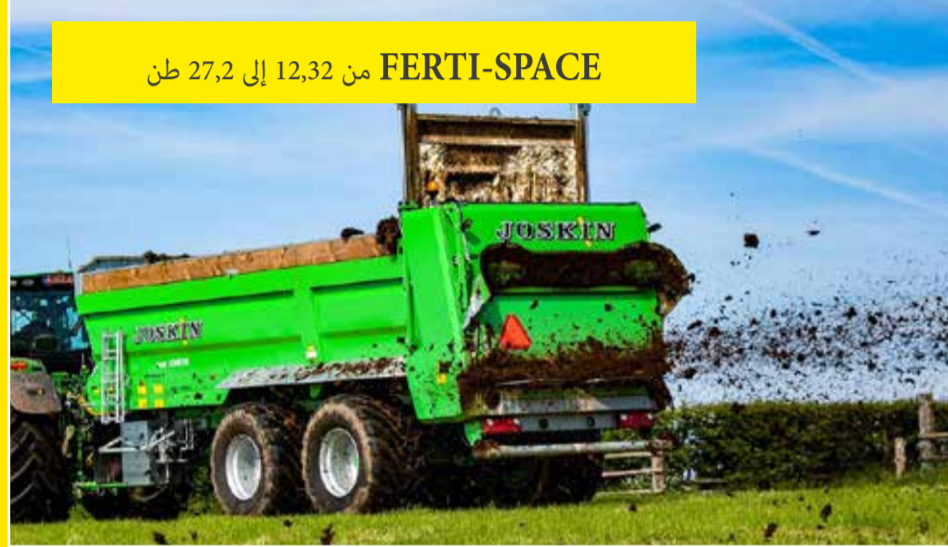
FERTI-SPACE من 12,32 إلى 27,2 طن