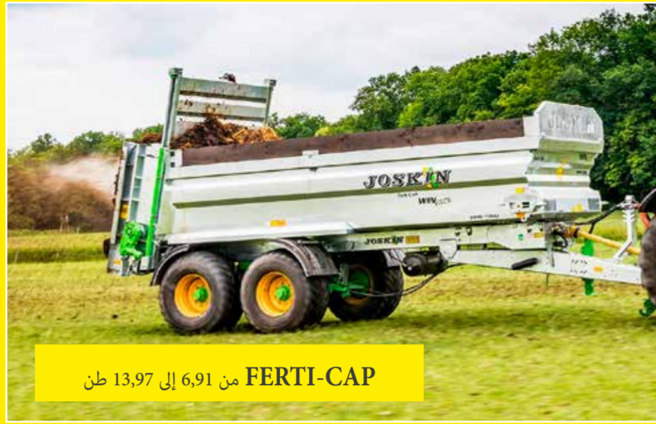
FERTI-CAP من 6,91 إلى 13,97 طن