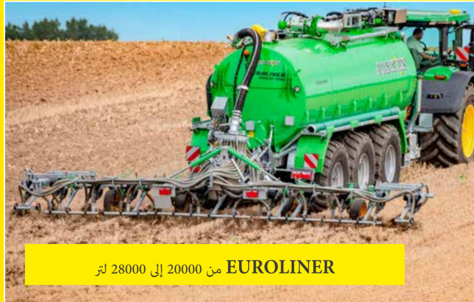
EUROLINER من 20000 إلى 28000 لتر

تضم مجموعة آلات JOSKIN لنثر الطين السائل على أكثر من 75 نموذج، أكثر من 700 خيار لتلبية احتياجاتك. تعتمد على نوعية خاصة من الفولاذ يتم اختيارها بعناية. يمكن تجهيز جميع صهاريج الطين السائل بأدوات خلفية حسب حاجتك.