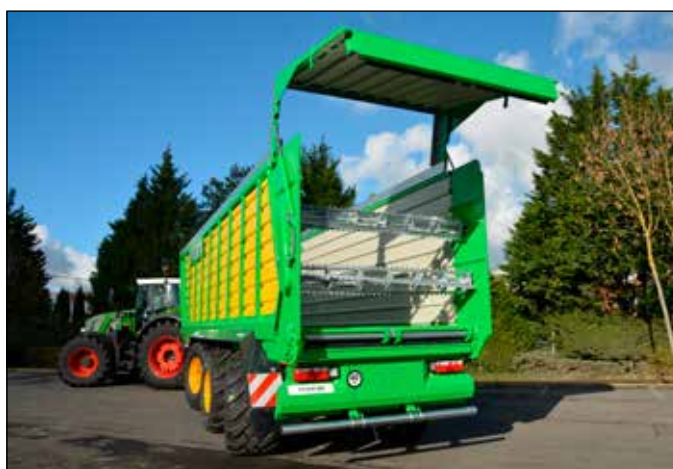
Porte à grand dégagement et rouleaux doseurs (en option)

Données non-contractuelles, susceptibles d'évoluer.