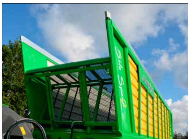
Paroi avant "articulée"