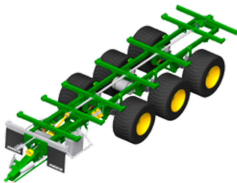
Châssis robuste et léger

Il sera désormais plus aisé de démonter la caisse pour envoyer la machine par conteneurs sur les marchés d'outre-mer, comme l'Amérique du Sud et du Nord ou la Nouvelle-Zélande et l'Australie.