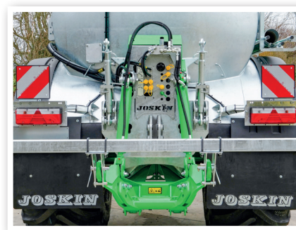
Przygotowanie do bardzo zwartej podnośnika