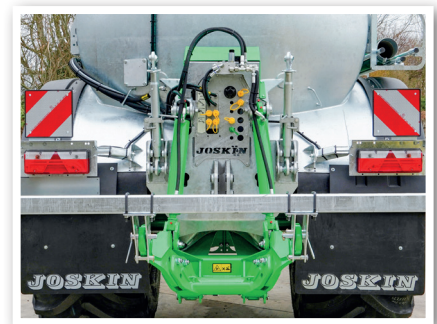
Pre-equipamiento para elevador muy compacto