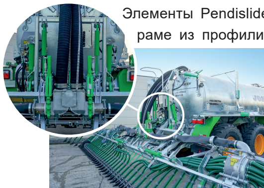
Орудие с четырьмя цилиндрами

Элементы Pendislide Pro установлены на легкой и прочной оцинкованной стальной раме из профилированных труб. Промышленные муфты, установленные на ней, являются износостойкими, имеют долгий срок службы и не требуют сложного обслуживания. Традиционный гидравлический 4-точечный подъемник не требуется для большинства цистерн, если диаметр колес составляет 1 675 мм или менее (например: 750/60R30.5). Четыре цилиндра орудия позволяют поднимать или опускать крылья рамы (и, следовательно, элементы внесения) во время работы, активируя таким образом противокapельную систему Twist и поднимая штангу над грезезащитными крыльями