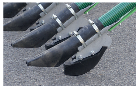
Сошники из эрталона

JOSKIN Pendislide Pro выпускается в четырех вариантах с рабочей шириной от 12 до 18 метров и расстоянием между рядами 25 см. Каждый элемент состоит из стойки шириной 70 мм, на которой установлен сошник из эрталона. Этот сошник прорывает в почве небольшую борозду, в которую у корней растений вносится жижа. Таким образом, любое загрязнение культур сведено к минимуму. В регионах с каменистыми почвами сошники из эрталона в опции можно заменить на эквивалент из литой стали.