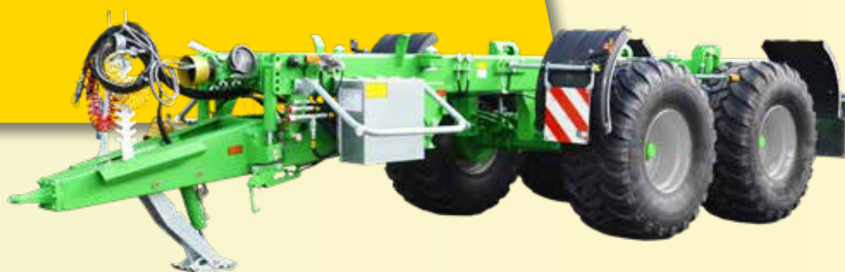
Ferti-CARGO (3 modele)