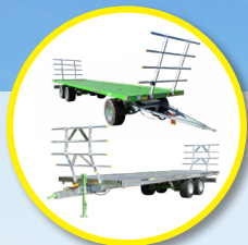
Getrokken of half-ge dragen balenwagens (van 6 tot 11,7 m)