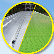
Bodemplaat van gegalvaniseerde gezette staalplaat of geverfde tranplaat