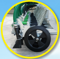
Pincettes anti-gouttes à fermeture hydraulique