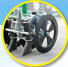
Disques auto-affûtants de 400 x 20 mm sur moyeux avec « graissage à vie »