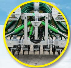
Châssis entièrement galvanisé avec système pendulaire