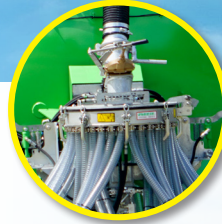
Répartiteur Scalper excentrique horizontal (Solodisc) ou vertical (Solodisc XXL)