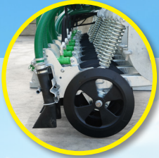
Pincettes anti-gouttes à fermeture hydraulique