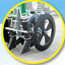
Disques auto-affûtants de 400 x 20 mm sur moyeux avec « graissage à vie »