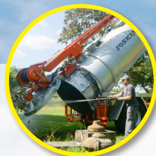
Наклоняемая цистерна с открывающейся задней стенкой с гидроприводом