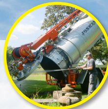
Przechyłany zbiornik z denną otwieraną hydraulicznie