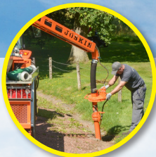
Ręczny wyciąg z przeciwwagą Ø 4"