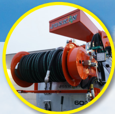
Węże czyszczące 3/4" dł. 50 m