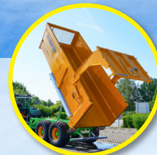
1-delige hydraulische deur met rubberen afdichting en in de armen ingebouwde deurcilinders