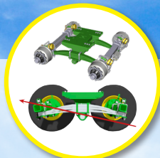
Roll-Over vering om de tractie in moeilijke omstandigheden te vergemakkelijken