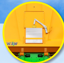
Centrale graanschuif (500 x 500 mm)