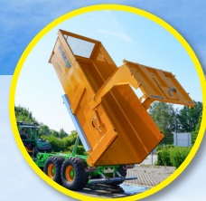
Porte hydraulique en 1 partie avec joint en caoutchouc et vérins intégrés aux bras de porte