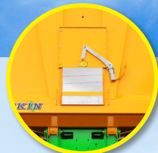
Trappe à grains centrale 500 x 500 mm