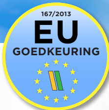
Goedkeuring voor 34 t