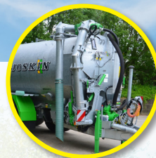
Met of zonder zuigarm