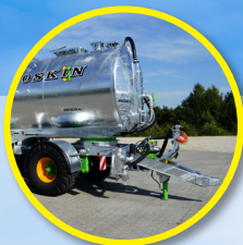
Tetrainer: Dolly en luchtvering