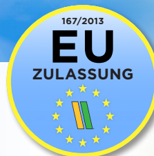
Zulassung 34 t