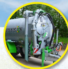
Mit oder ohne Ansaugarm