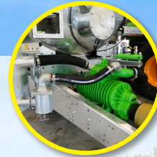
Vakuumpumpe (11 000 l/min) oder Schneckenpumpe (3 666 l/min)