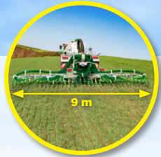
Pendislide START 90/36PS1 Schleppschuhverteiler