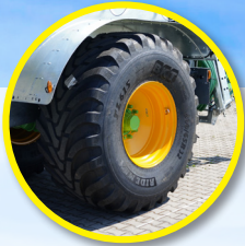
Radkasteneinbau: Bereifung 800/65R32