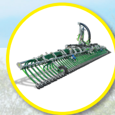
Pendislide PRO 120/48PS2 sleepslangboom