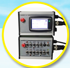
Elektrohydraulische bediening met Touch-Control