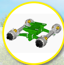
Bogie Roll-Over con eje seguidor