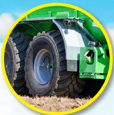
750/60R30.5 Trelleborg z kontrolą ciśnienia