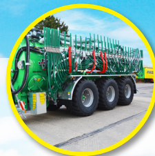
Rampa rozlewająca 30 m