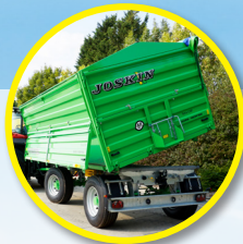
Burty 2 x 80 cm całkowicie demontowane