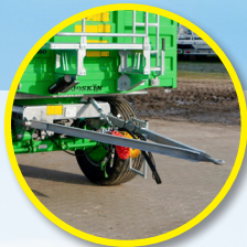
Dyszel typu Y - łatwe manewrowanie