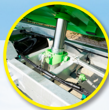
Ocynkowana i obniżona rama