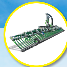
Rampa de 15 m Pendislide PRO 150/60PS2