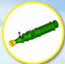
Bomba helicoidal 4 500 l/min